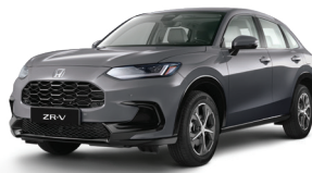
Modern Steel Metallic