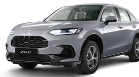
Urban Gray Pearl

Las especificaciones y el equipamiento pueden variar, ya sea por razones técnicas y/o comerciales sin previo aviso. Origen: México