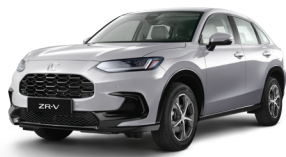
Lunar Silver Metallic